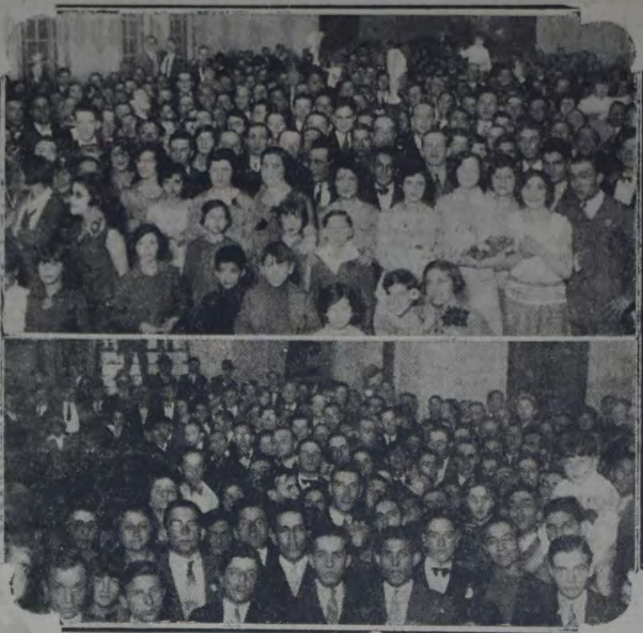
Las vistas parciales de los concurrentes a la fiesta de ayer

La Casa del Pueblo vibró ayer como en sus mejores días.